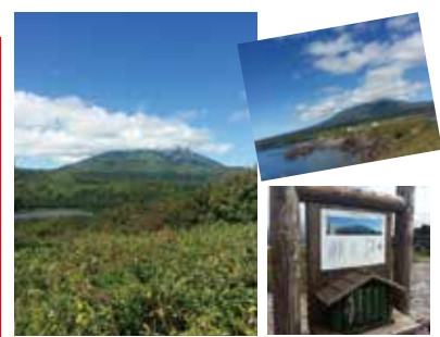
利尻島、行ってみたかったところのひとつだったのですね!きれいな写真をありがとうございます。(編集部より)

北海道に移住してきて、行ってみたかったところの一つでした。自然の美しさに感動しました。利尻島は海からそびえる山みtainな島です。一周どこからも利尻山が望め、逆さ富士のように映る池があったり、北海道の製菓屋さんのイラストのモデルになった風景など、また行きたいです。日本の最北に位置しているところですが、島自体が山のため、風の吹いてくる方向によって、雲が発生して山が見えないけど、反対側は晴れていてきれいな山が望めたりと日本列島をコンパクトに凝縮したような気候があげられます。